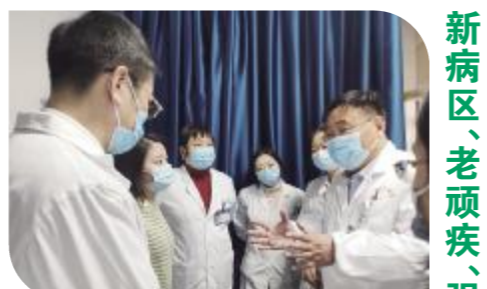
新病区、老顽疾、强扶持、获盛誉 (上接第2版)以解决患者痛苦为己任,着力科室、立足医院,夯实基础、永攀高峰!