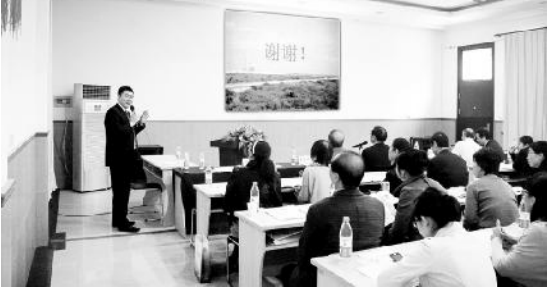
上海市慈善基金会资助的项目

这次厦门学习还有个任务是去医院新购的金旅考斯特车提车回沪,厦门至上海高速距离为1200公里左右,沿着沈海高速由南往北一路目的上,在确保安全为上的基础上,发扬后勤的团队精神,行车途中我们相互帮助,相互鼓励,顺利地完成任务。