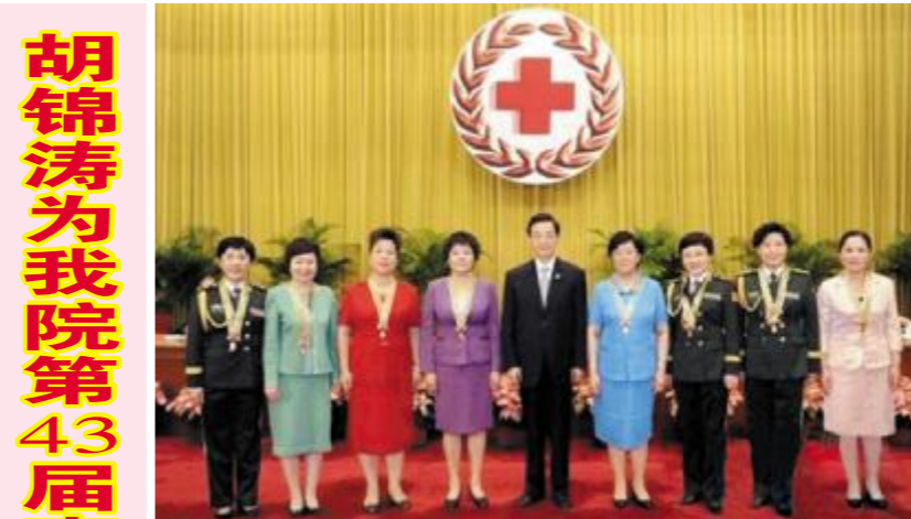
胡锦涛为我院第43届南丁格尔奖章获得者颁奖

上海市皮肤病医院主办 长宁区门诊部:武夷路200号(总机:61833000) 2011年8月30日 第8期(总第23期) 网址:http://www.shskin.com