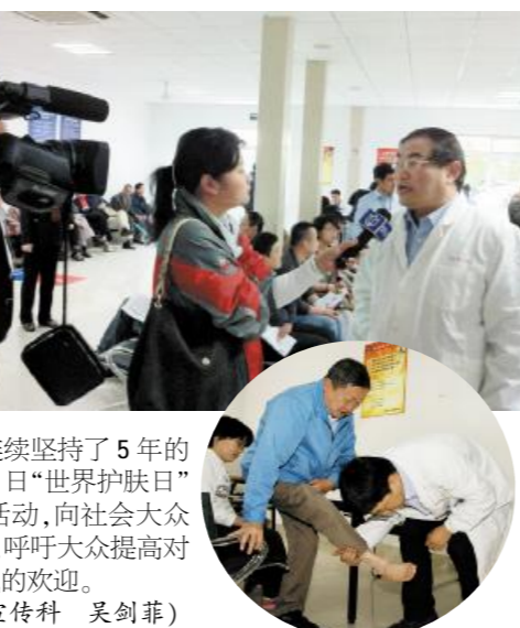
我院与医药企业签署购销廉洁协议

联合上海各大医院皮肤病专家在上海市皮肤病医院为市民免费问诊、进行医疗指导,已经是我院连续坚持了5年的传统项目。每年在5月25日“世界护肤日”前后,医院都会开展这项活动,向社会大众宣传正确的皮肤护理知识,呼吁大众提高对皮肤健康的关注,深受居民的欢迎。(文明办/宣传科 吴剑菲)