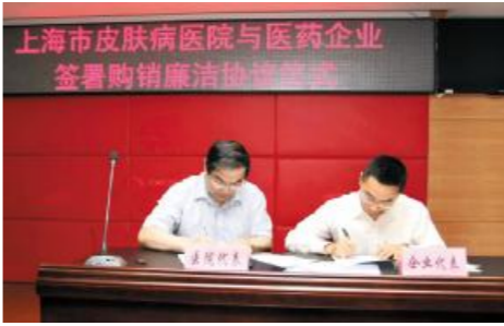
上海市皮肤病医院与医药企业签署购销廉洁协议

为进一步强化廉政建设和纠风工作,认真贯彻落实2012年全国卫生系统纪检监察暨纠风工作会议精神,切实抓好医院治理医药购销领域商业贿赂的专项工作。5月7日下午,我院在保德路第一会议室举行了医院与医药企业购销廉洁协议签署仪式。