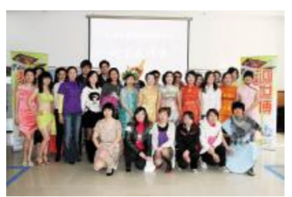
手有医生、护士、检验师、行政人员、财务人员、后勤人员等等,我们看到的是与平

本报讯 上海世博会即将隆重举行。老年病科是个高风险临床科室。为保证世博会期间科室的安全,近日科室开展了一系列平安世博活动,目的是在世博期间科室要正常有序有效运作,提供好的质量、好的服务和科室平安安,努力做到防止发生医疗纠纷和事故,防止发生病人意外伤害,防止发生意外突发事件,防止发生服务投诉,防止发生重大医院感染和防止发生群体性事件。近日科室对六个防止中最核心的防止发生医疗纠纷和事故进行了重点部署,强调病史内涵质量和规范医疗文书,检查科室医疗器械特别是抢救仪器保持在随时待用状态,检验医护人员的快速反应能力,演练医护人员的急救基本技术和急救仪器的正确使用,培训医护人员与病人或家属的沟通技巧等。同时科室还设立了老年病科情况报告记录本,要求凡有事报告一定要做好记录。在防止发生意外伤害事件时,科室与关爱护工服务公司的管理老师进行沟通,并对护工在世博期间提出增强责任意识,增强安保意识和增强服务意识的要求,加强检查和督导,对于安全防范意识差、服务质量差和责任意识差的不放心护工要进行重点关照和教育。(老年病科 秦家榕)